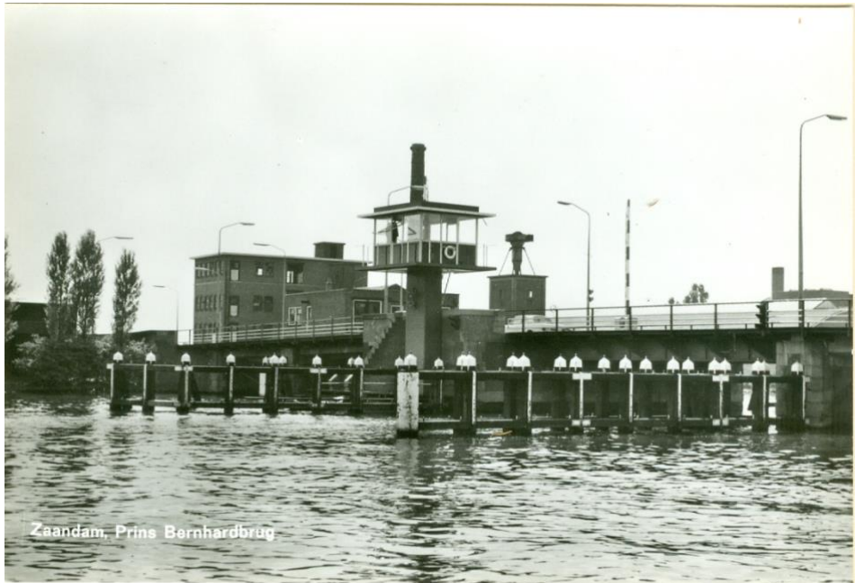
Prins Bernhardbrug met het vernieuwde brugwachtershuisje

In deze eeuw was de Bernhardbrug alweer verouderd en werd er in 2007 een nieuwe brug geopend.