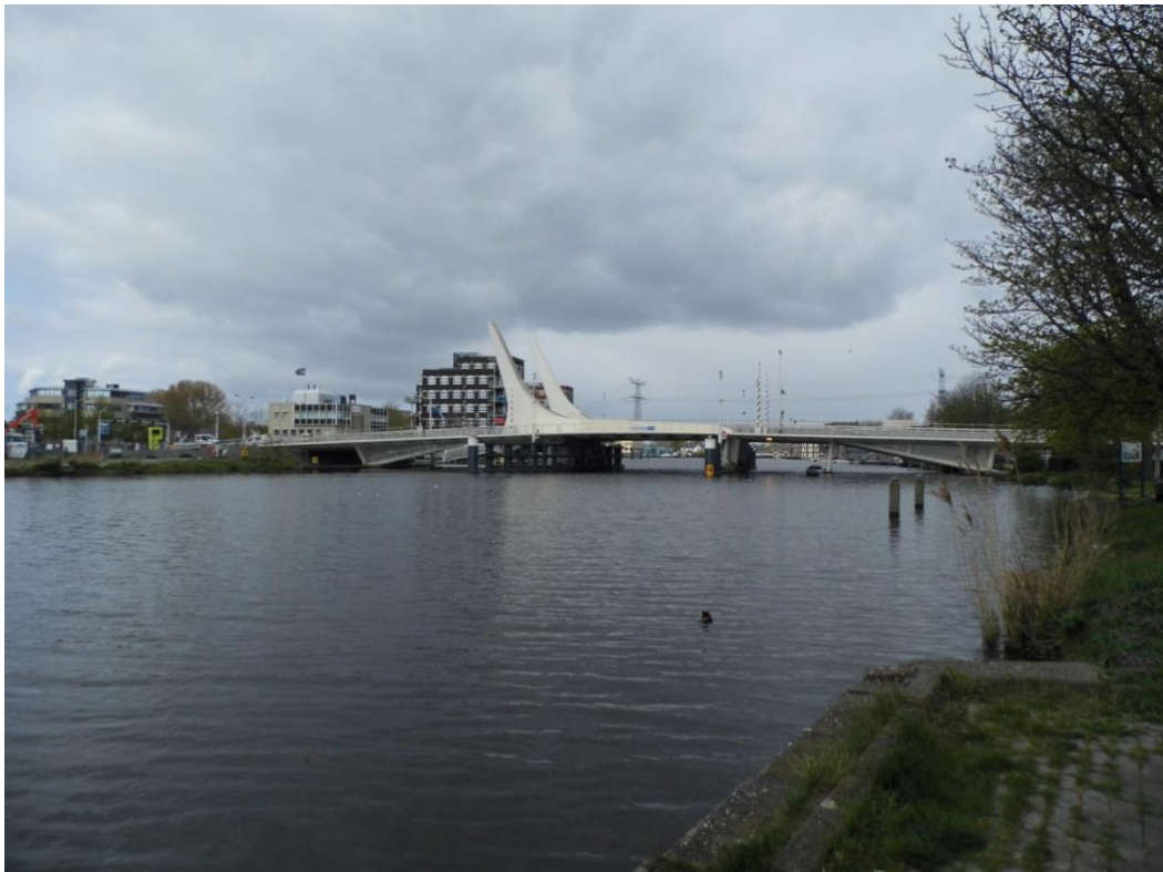
De nieuwe Prins Bernhardbrug

Nog een ding wil ik graag kwijt: Als ik bij de afrit van de brug ben, hoor ik nog steeds de klanken van De Schaatsenrijderswals van Emile Waldteufel. Op de plaats van de weg was 70 jaar geleden de ijsbaan Willem Barentsz. In de wintermaanden werd daar minstens 50 keer per dag deze muziek tijdens de openingstijden gedraaid.